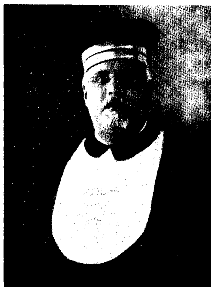
הרב פרופסור דוד פראטו כאשר שימש כרב הראשי של אלכסנדריה

[...] כאן מתחוללת היסטוריה [...] לא קיים בכל רחבי אגן הים התיכון, פרט לארץ-ישראל ולאיטליה, מוסד מסוגו של בית-המדרש לרבנים ברודוס. די בכך כדי שאתם, אחים, תשתכנעו בחשיבות היוזמה, כפרט עתה, כאשר משבר הרבנות ניכר בכל קהילות ישראל במזרח. אוכל להבטיחכם כי מפעל זה עונה על כל הצרכים המודרניים, ועבודתם ללא לאות של חבר המורים יצרה את האווירה הנאותה ביותר לעיצובם של הרבנים לעתיד. אם אתם רוצים שרודוס היהודית תהיה מפורסמת בהיסטוריה, ראו אפוא כחובתכם לשלב את בית-המדרש לרבנים במוסדות קהילתכם. זכותכם שלא להתייצב בוודים למילוי משימתכם זו, אלא להיפך, זכאים אתם לעזרה ולתמיכה. אני מבטיחכם כי עזרה זו לא תחסר. 50