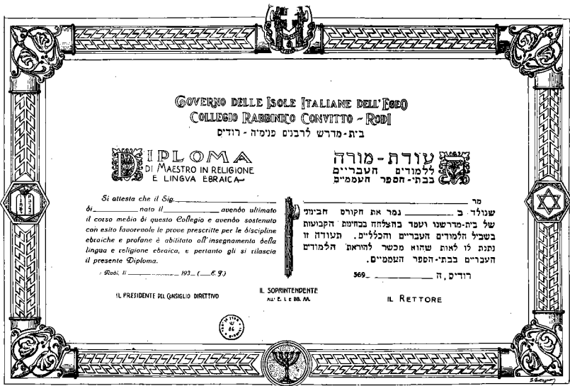
תעודת מורה שהוסמך בבית-המדרש ברודוס

ובניהולו של בית-המדרש, שהיקנו לו מוניטין בכל רחבי העולם היהודי, התאפשר גם על-ידי כך שהשלטונות הקצו מבנה חדש, מפואר ונוח ששכן מחוץ לרובע היהודי ברודוס וגם הודות לרמת-הלימודים הרצינית והאמינה של המוסד.