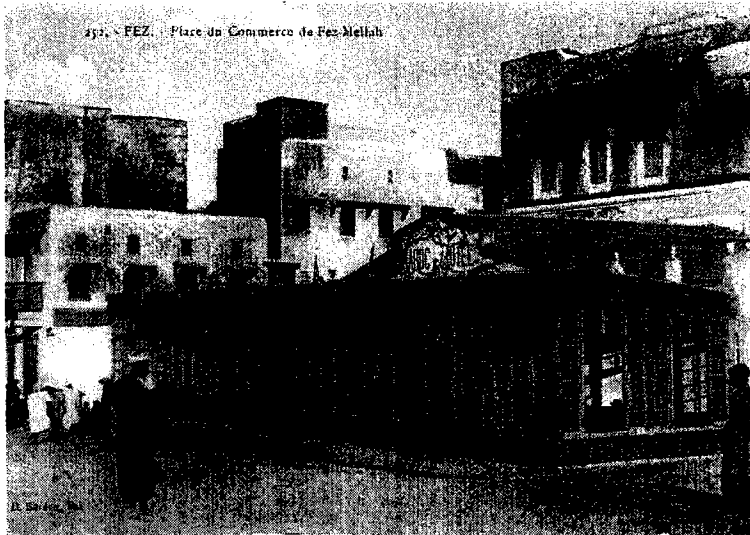
כיכר המסחר במלאח של פאס, שנות העשרים של המאה העשרים

ואולם בעלי יכולת ויזמה יכולים היו לצאת מחוג נמוך זה של הפקידות ולהתקדם מעלה, כפקידים בכירים וכמנהלים בבנקים ובחנויות גדולות. אחדים מהם פתחו עסקים מודרניים, ומעטים נקלטו אף בפקידות הממשלתית הגבוהה.