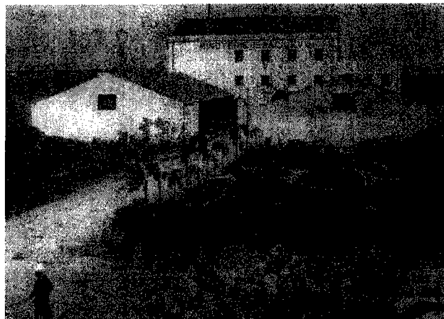
טחנת הקמח של יצחק לוי, קזבלנקה, 1917

לפי הנתונים ייצגו המפרנסים פחות משליש מן האוכלוסייה היהודית (לפי מפקד 1947 מנו היהודים כ-200,000 נפש), שיעור גבוה במעט מזה שאצל המוסלמים. שאלה שעניינה את עורכי הסקר של הגוינט הייתה אחוז הילדים בין המפרנסים. לפי האומדן היו כ-338 מכל 1,000 יהודים מתחת לגיל 15, ו-80 בלבד מעל לגיל 60. לפיכך העריכו כי שיעור המבוגרים בני 15-60 הוא 582 ל-1,000, מתוכם כ-290 גברים. מהערכות אלה התברר כי ילדים רבים מתחת לגיל 15 עבדו. שיעור המפרנסים הגבוה וחלקם הגדול יחסית של הילדים בקרבם מעידים על מצבן הכלכלי של המשפחות היהודיות: כדי להתפרנס נדרשה המשפחה לאמץ את כל כוחותיה ולרתום לעתים קרובות גם את הילדים, וכך נפגעו סיכוייהם להיחלץ ממעגל העוני.