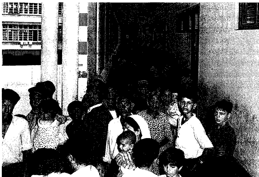
פליטים מוצאים מחסה בבית ספר יהודי לאחר פגיעות ביהודים, קזבלנקה, 1955

עמם. כאשר הדיחו השלטונות את הסולטאן מכיסאו בשנת 1953 ומינו במקומו את מולאי בן עראפה, סולטאן-בובה, תמכו כנראה רוב היהודים בצעד זה. נטייתם הפרו-צרפתית, שנקלעה למשבר בתקופת המלחמה, התאוששה. הם קיוו לשקט והאמינו כי חייהם בטוחים תחת שלטון הצרפתים יותר מאשר תחת הערבים.