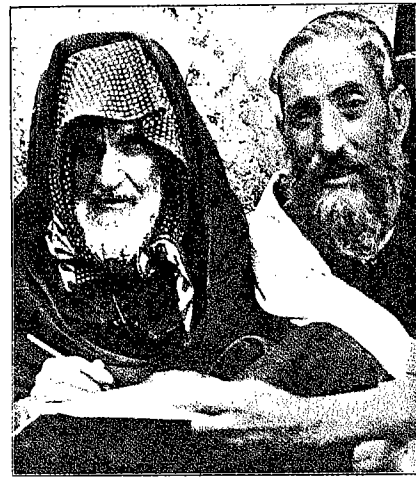
Au carrefour de la rue des Synagogues, indifférent à la foule qui passe, un père dit à l'écrivain-publié-rabbin-écrivain-d'actes, une lettre à son fils resté dans la montagne: «Tu lui diras que son père songe nuit et jour à l'absent... et que tout va bien à la L'Héca!»