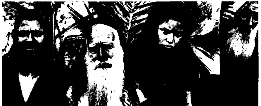
קבוצת יהודים ממראכש, 1914

שורה של נקודות יישוב עירוניות מתגלות על פי הנתונים כמקומות שהאוכלוסייה היהודית בהן לא גדלה, ואף קטנה מעט. כאלה הן צפרו ומזגאן במרוקו הצרפתית, תיטואן שבמרוקו הספרדית, וטנג'יר – העיר הבין-לאומית. לכל הערים הללו, למעט טנג'יר, לא היה בתקופה הקולוניאלית מעמד מושך מבחינה כלכלית או מינהלית. לפיכך, לאור הגידול הרב במספר היהודים בערים, הייתה לקפיאה על השמרים משמעות מעשית של שקיעה. טנג'יר, לעומת זאת, הייתה עיר משגשגת ובעלת אוכלוסייה יהודית חזקה יחסית, אך נראה שדווקא משום כך היא נמנתה עם הערים הראשונות שמהן היגרו צעירים בעלי כישורים אל הערים המתפתחות האחרות של מרוקו, ובראשן קזבלנקה, וכן אל מעבר לים, ובמיוחד לאמריקה הדרומית. האפשרויות לקידום אישי ומקצועי בצפון מרוקו היו מצומצמות. גם אוכלוסיות של ערים אחרות, שאוכלוסייתן היהודית גדלה רק במעט בתקופה הצרפתית, ירדו מבחינת משקלן הדמוגרפי במפת יהדות מרוקו. כאלה היו שתי הבירות המסורתיות של מרוקו לפני הכיבוש הצרפתי, פאס הצפונית ומראכש הדרומית. מראכש ירדה אמנם מן המקום הראשון רק לשני, אך ההפרש בינה לבין קזבלנקה, שעלתה למקום הראשון, היה עצום, כ-60 אלף נפש. פאס שמרה על מקומה השלישי ברשימה, אך היא צמחה בפחות מחמישים אחוז, כלומר הרבה פחות משיעור הצמיחה הכללי של יהודי מרוקו בתקופה הקולוניאלית. סאפי וסאלה שלחוף האוקיינוס האטלנטי לא עמדו בתחרות עם ערים זוהרות יותר בחוף, וזה היה גם דינן של לראש ואלקסר אלכביר שבאזור הספרדי.