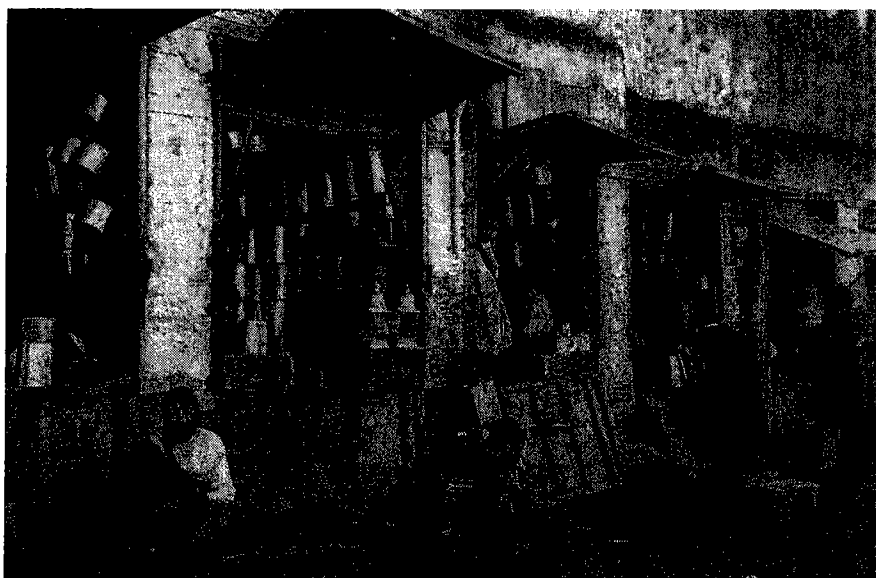
שוק הפחחים, מכנאס, ראשית המאה העשרים

עולם המסחר היהודי במרוקו היה אפוא מגוון בתקופה זו, ונע בין קצוות של עושר מופלג לעוני מדכא, בין שותפות בשוק העולמי ובטכניקות העסקים המתקדמות ביותר לריתוק לעולם הכלכלה המסורתית ולשוק המקומי הילידי בלבד. היהודים בעלי המעמד האירופי בלטו בחוד הפירמידה הריבודית והמקצועית.