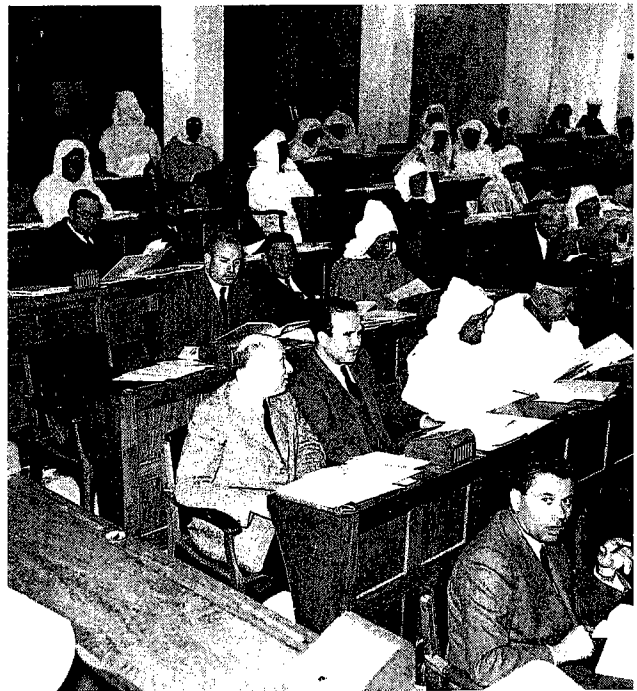
מועצת הממשלה, רבאט 1952. ששת הנציגים היהודים יושבים משמאל (בחליפות)